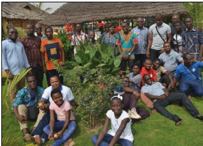
Un groupe de laïcs assomptionnistes en RD-Congo.

Dans ce que j'ai entendu, le discours sur le souhait de s'ouvrir et d'accueillir d'autres personnes est concomitant avec celui de l'appréciation d'être en petit nombre, de se connaître tous, d'avoir l'impression d'être dans un groupe plus humain et chaleureux parce que pas très nombreux. La question de « l'ouverture » gagnerait à être réfléchie en termes d'objectifs : pour aller vers où ? pour quoi faire ? Quelles communautés veut-on construire ? Il y a sans doute encore un chemin de dépossession des représentations