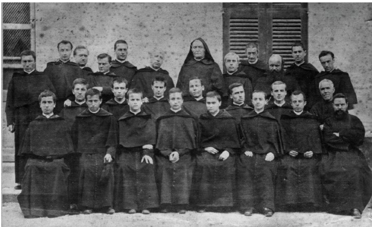
Le P. d'Alzon au milieu de ses religieux (photo du 29 septembre 1879).

en Turquie, « non pas à Constantinople où tout est trop cher, mais à quelques minutes de là, à Chalcedoine où il faut se dépêcher » 12 .