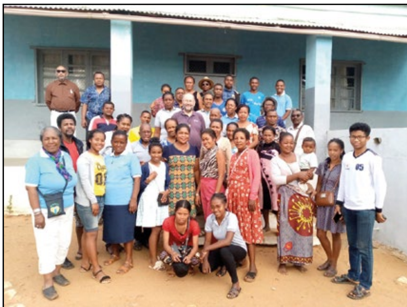
L'assemblée générale de l'Alliance de Madagascar.