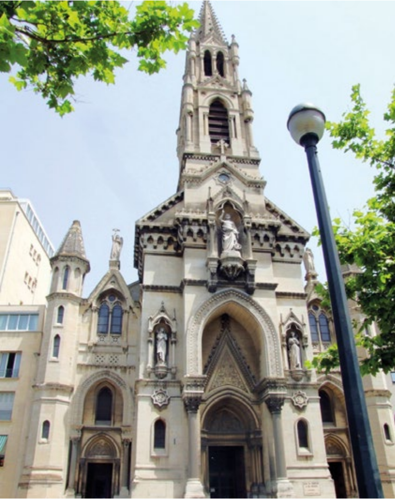
L'église Ste-Perpétue – Ste-Félicité de Nîmes.