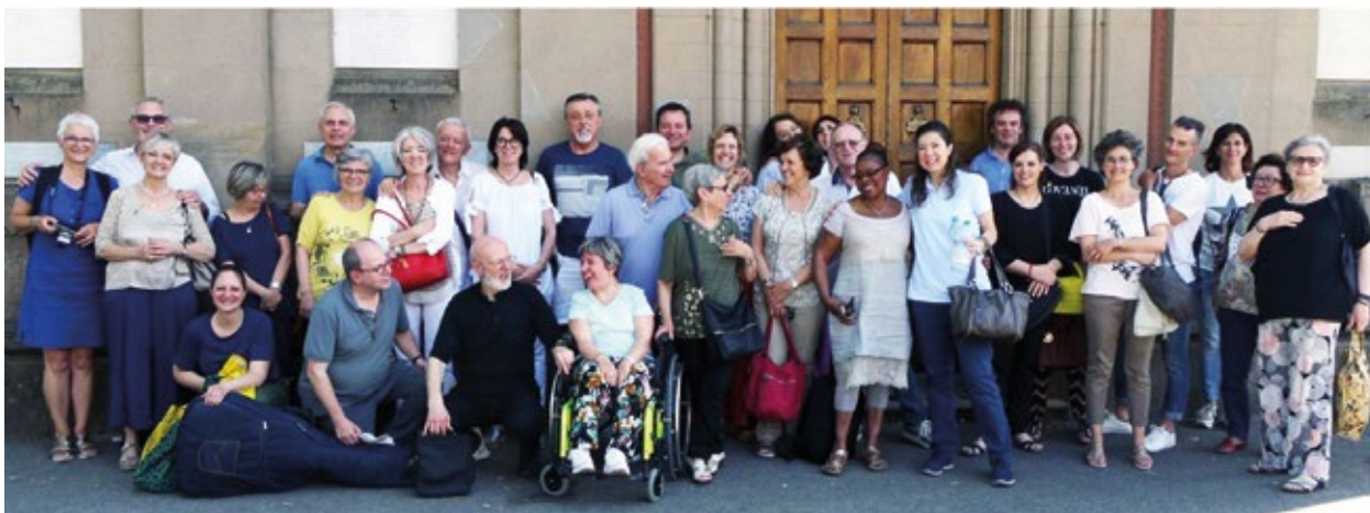
Un pèlerinage de l'Alliance Laïcs-Religieux de la Province d'Europe.

Nous poursuivons la publication de textes de réflexion suscités à partir du thème de notre prochain Chapitre général : « “Le Règne de Dieu est tout proche” (Mc 1, 15). Vivre et annoncer l'espérance de l'Évangile ». Voici la contribution d'une laïque de l'Assomption sur les enjeux de l'Alliance.